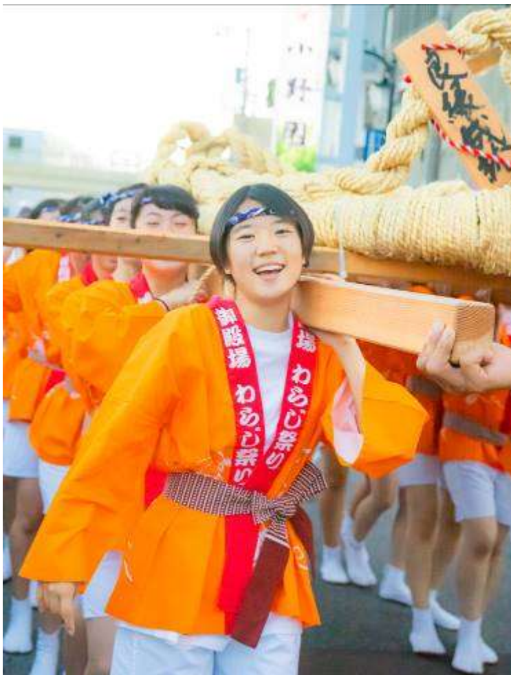
8月4日摄影 御殿场草鞋节